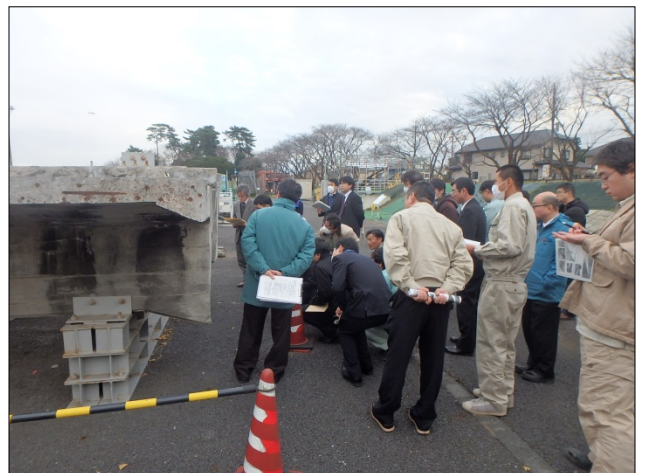
床版下のクラックと遊離石灰