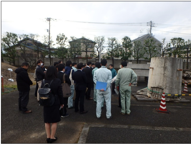
長野県北部地震 被災橋脚サンプル