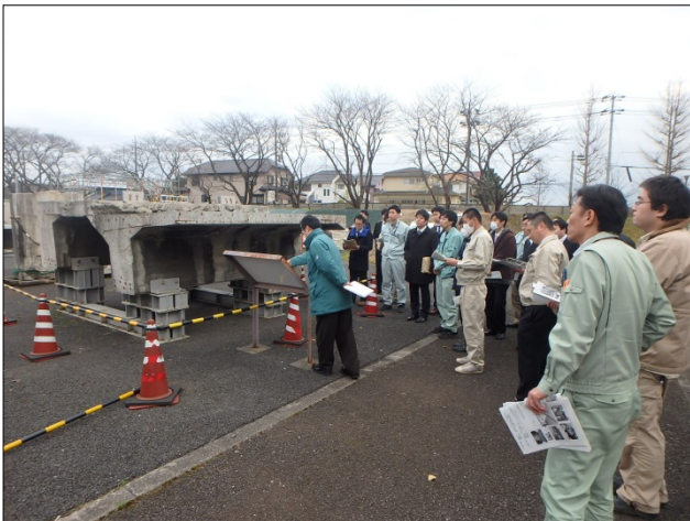
新宿跨線橋架替え床版サンプル