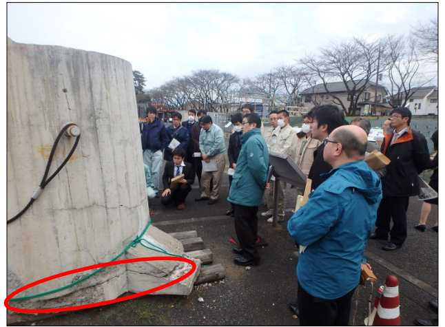
コールドジョイントに沿ったクラック