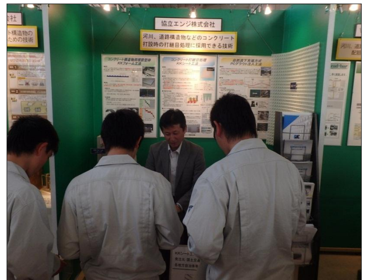
KKシート工法 協立エンジ株式会社