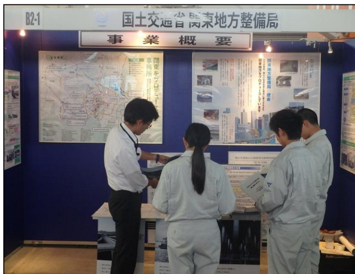
関東地方整備局の取り組み 関東地方整備局