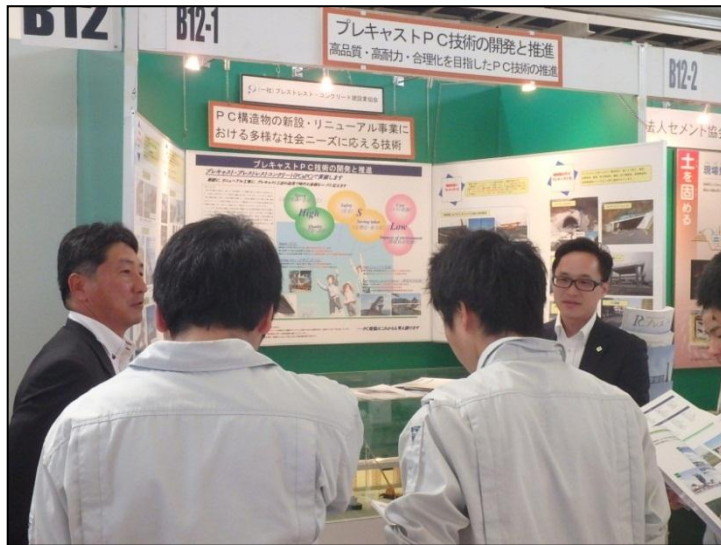
プレキャストPC技術の開発と推進 (一社)プレストレスト・コンクリート建設業協会