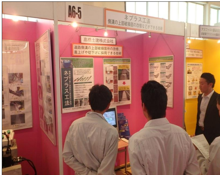
ネプラス工法 高橋土建株式会社