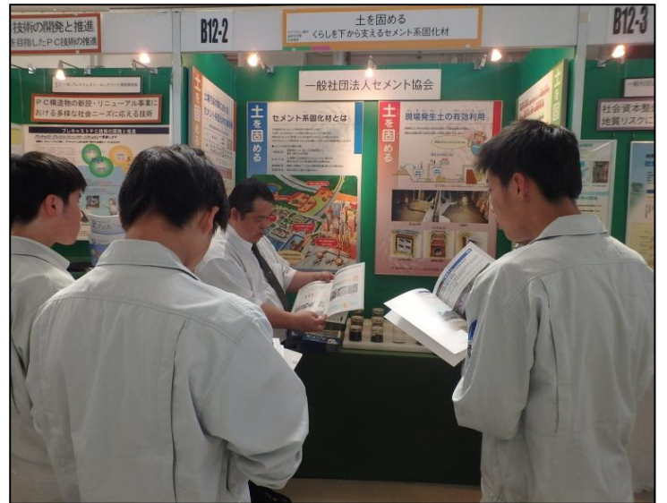
土を固めるセメント系固化材 (一社)セメント協会