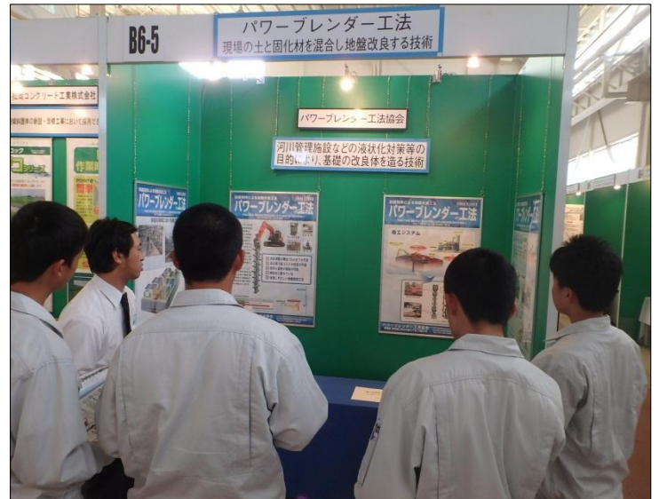
パワーブレンダー工法 パワーブレンダー工法協会