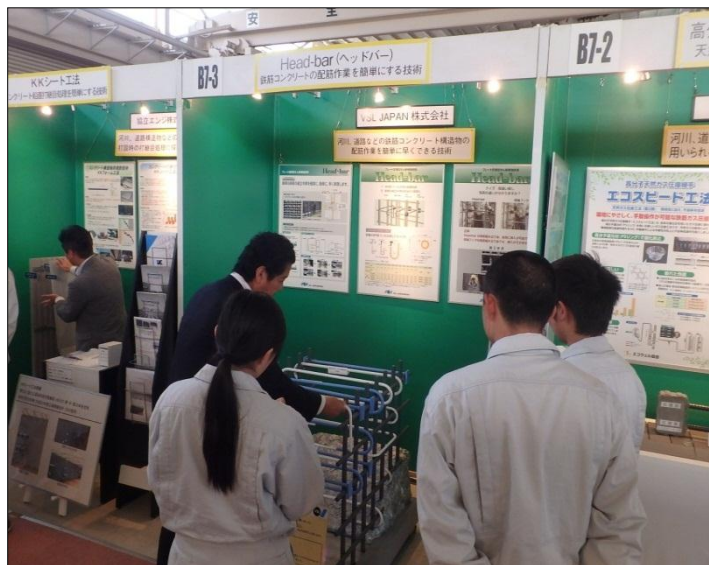
Head-bar (ヘッドバー) VSL ジャパン株式会社