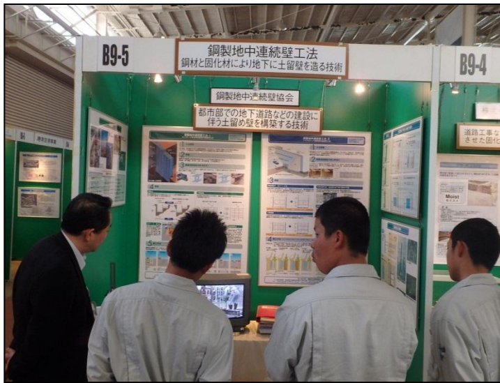
鋼製地中連続壁工法 鋼製地中連続壁協会