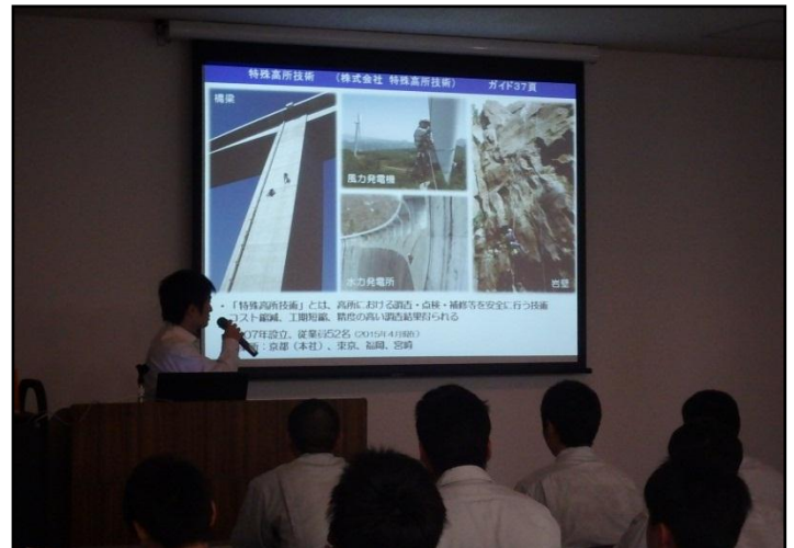
展示者による技術説明