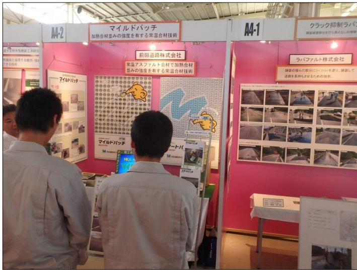
マイルドパッチ・スマートパッチ 前田道路株式会社