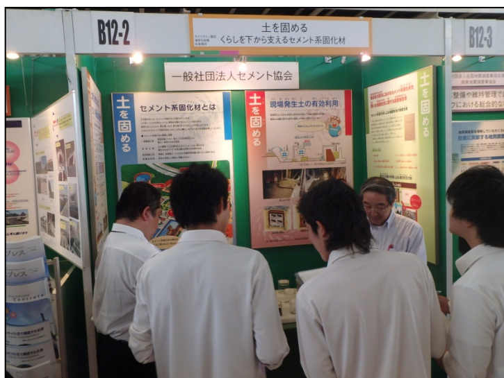
土を固めるセメント系固化材 (一社)セメント協会