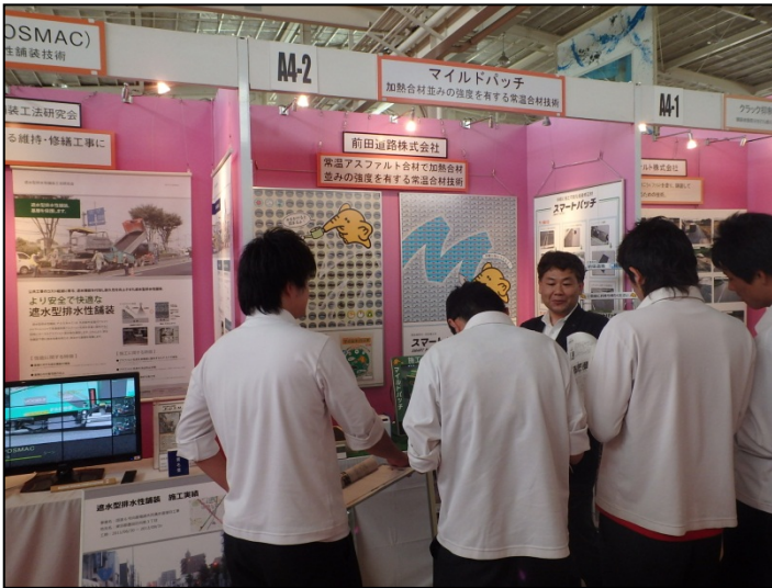
マイルドパッチ・スマートパッチ 前田道路株式会社