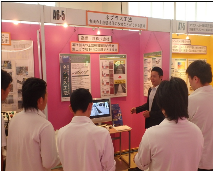
ネプラス工法 高橋土建株式会社