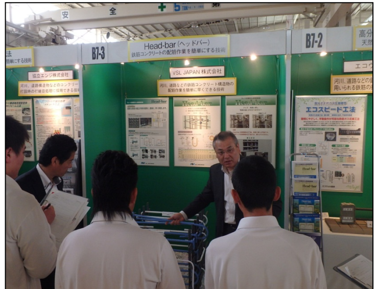
Head-bar (ヘッドバー) VSLジャパン株式会社