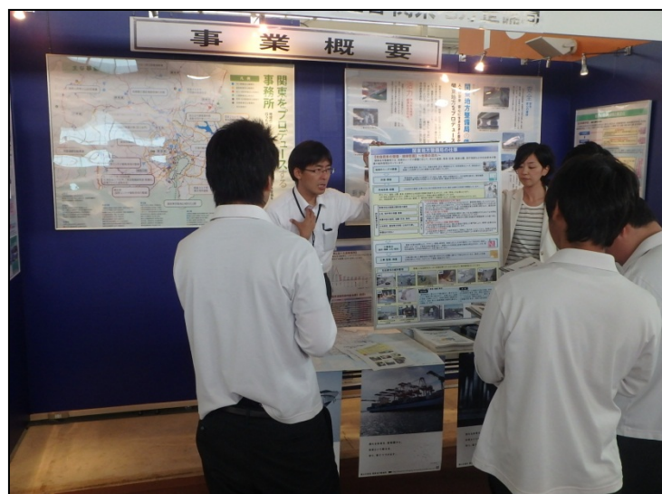
関東地方整備局の取り組み 関東地方整備局