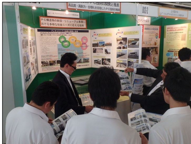
プレキャストPC技術の開発と推進 (一社)プレストレスト・コンクリート建設業協会