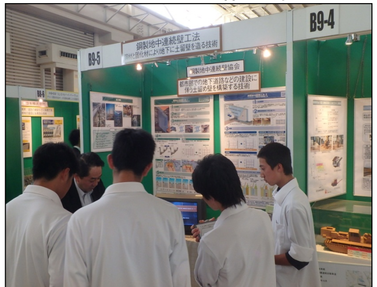
鋼製地中連続壁工法 鋼製地中連続壁協会