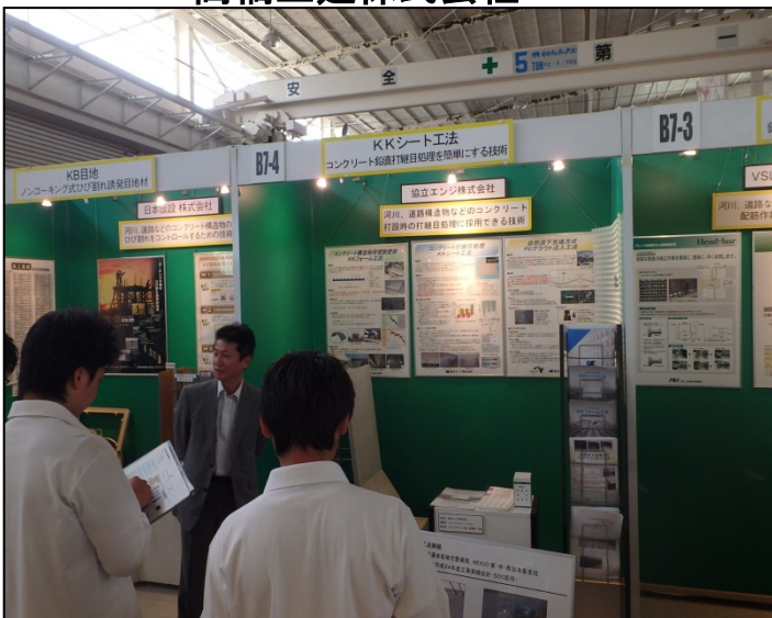
KKシート工法 協立エンジニア株式会社