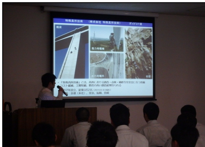
展示者による技術説明