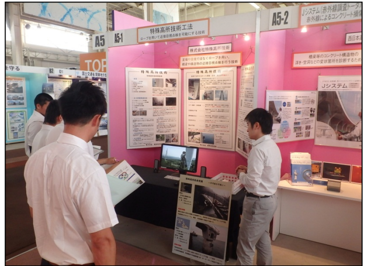
特殊高所技術 株式会社特殊高所技術