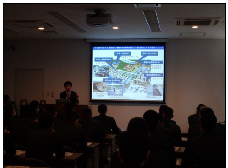
展示者8者による2分間概要説明