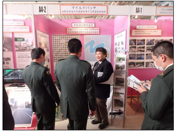
マイルドパッチ (前田道路株式会社)