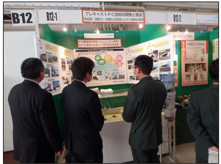
プレキャストPC技術の開発と推進 (一般社団法人プレストレスト・コンクリート建設業協会)