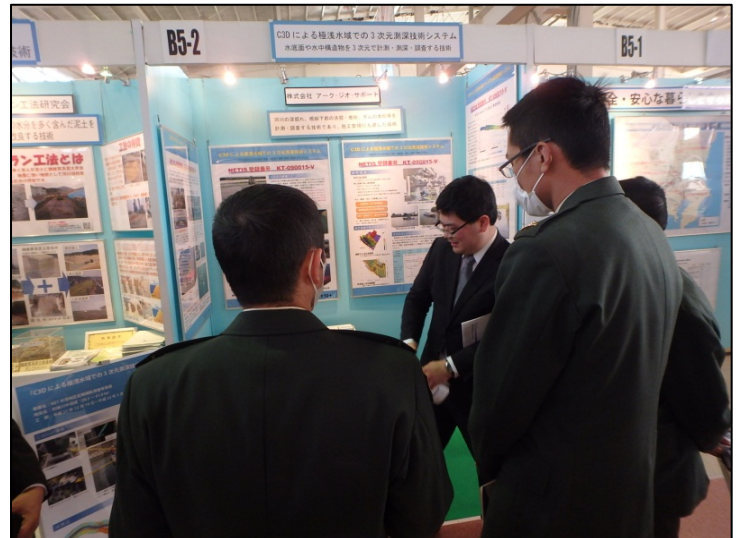
C3Dによる極浅水域での3次元測深技術システム 遠隔操作無人探査機 (ROV) による水底部微地形計測システム (株)アーク・ジオ・サポート