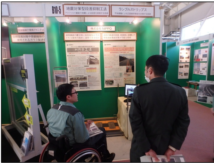
地震対策型段差抑制工法 (株式会社NIPPO)