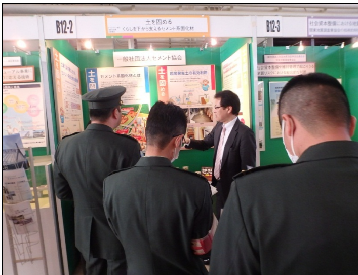
土を固めるセメント系固化材 (一般社団法人セメント協会)