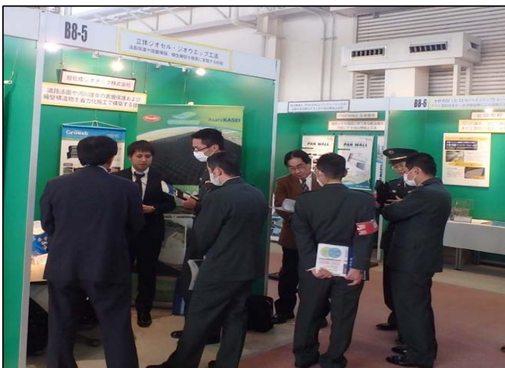
立体ジオセル・ジオウェップ工法 (旭化成ジオテック株式会社)