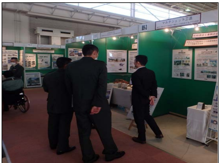
ジオブリッジ工法 (前田建設工業株式会社)