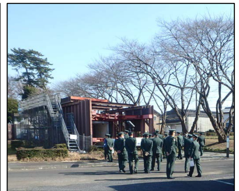
屋外展示見学状況