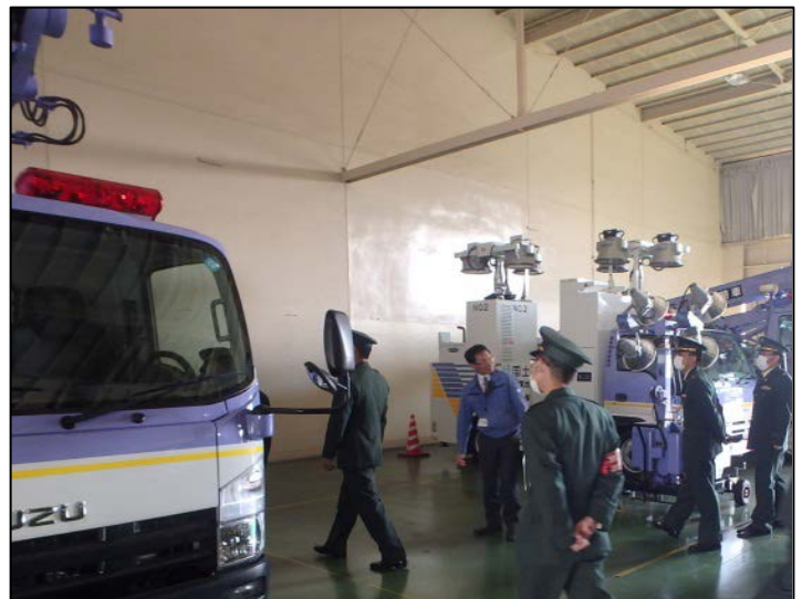
災害対策車両見学