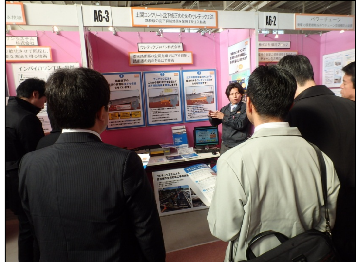
土間コンクリート沈下修正のための ウレテック工法 (ウレテックジャパン(株))