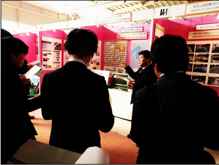
スマートパッチ (前田道路(株))