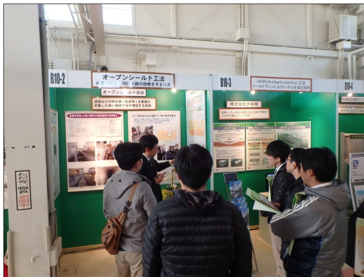
オープンシールド工法 （オープンシールド協会）