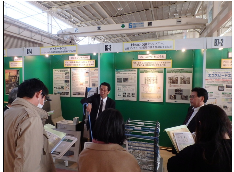
Head-bar（ヘッドバー） （VSL ジャパン（株））