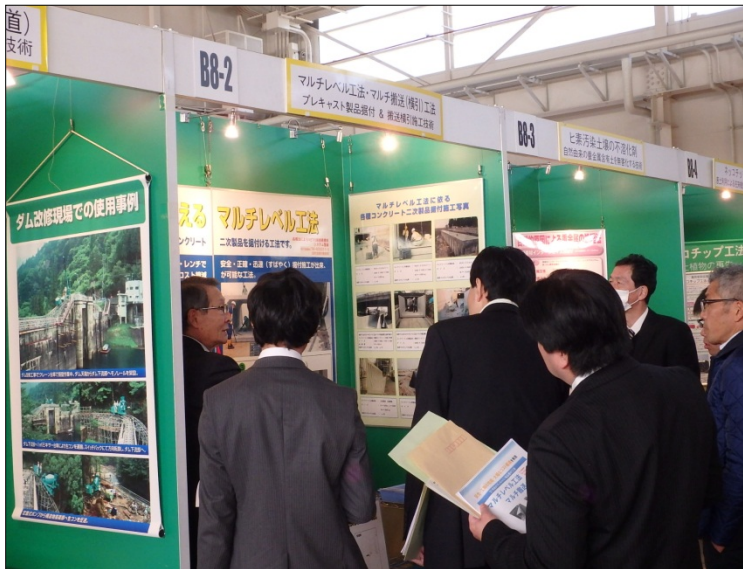
マルチレベル工法・マルチ搬送（横引）工法 （マルチレベル工法・マルチ搬送（横引）工法 研究会）