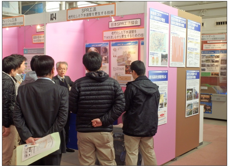
SPR工法 （日本SPR工法協会）